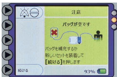
● 黄色：アラーム画面(注意)